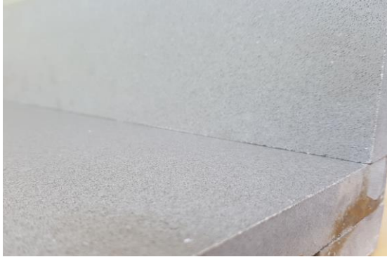
뒷면 사진 (면취 전)