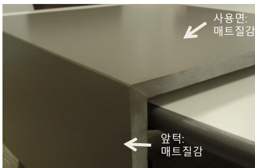
45도 접합 (45° miter edge profile)

2ply 방식으로 앞턱을 접합하는 경우, 앞턱은 매트질감으로 연마가 불가. 앞턱의 고광택과 사용면의 질감 차이가 날 수 있습니다.